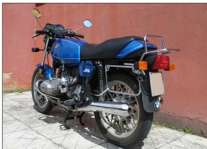
FOTO 2 - Vista ¾ posteriore con targa leggibile