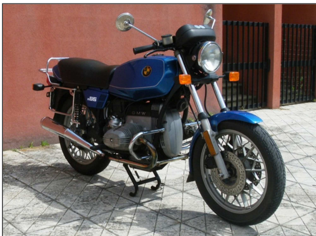
FOTO 1 - Vista ¾ anteriore

NELLE FOTO NON DEVONO ESSERE PRESENTI ALTRI VEICOLI PULIRE BENE IL VEICOLO – LA SELLA NON DEVE ESSERE LOGORATA